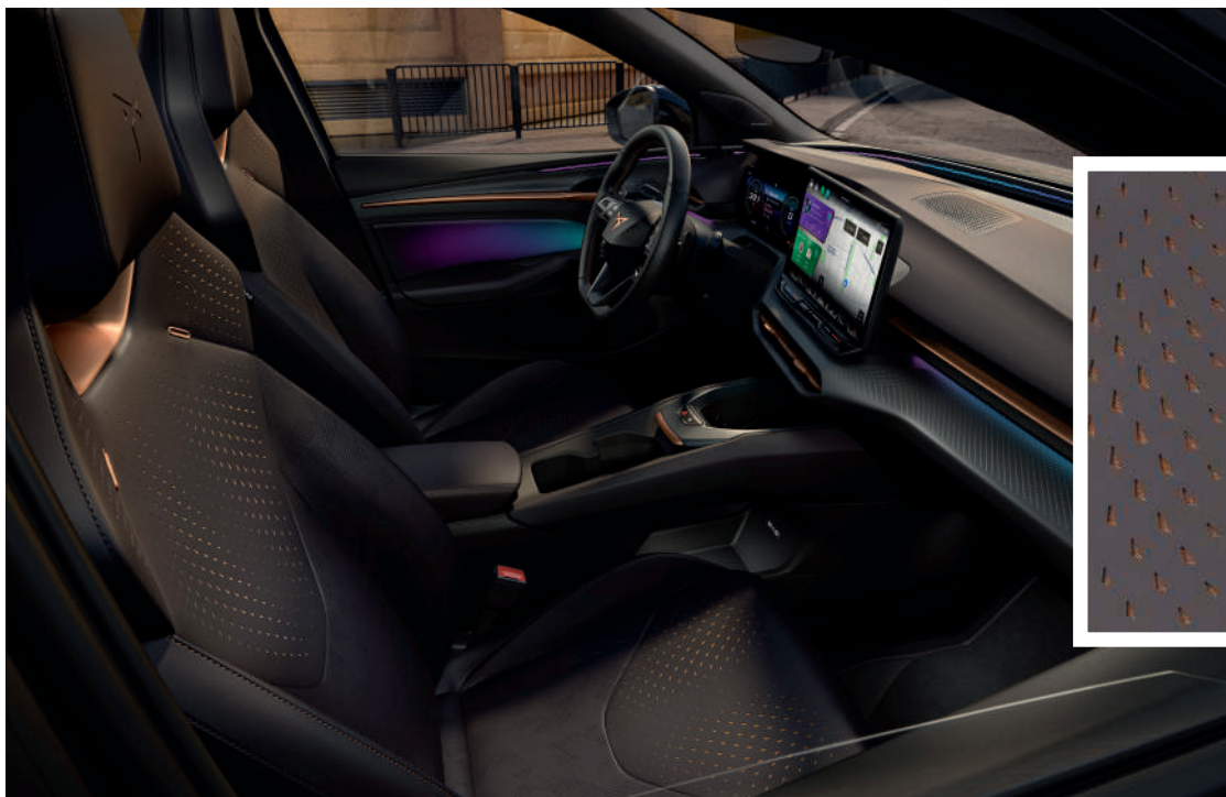
"DARK PURPLE" Vegan nahkistmete viimistlus (RAVAL / RAVAL Plus / ENDURANCE)