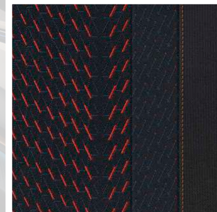
"PULSE" Tekstiilist istmeviimistlus (RAVAL / RAVAL Plus / ENDURANCE)