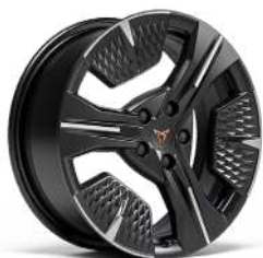
"DEFIER Machined" R18 • Machined/Black (Raval Plus / Endurance)