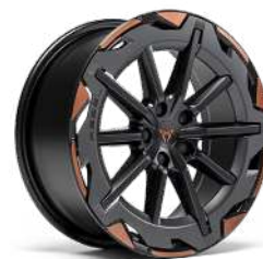
"REBEL" R19 • Machined/Grey/Sport Black/Sulfur (VZ)