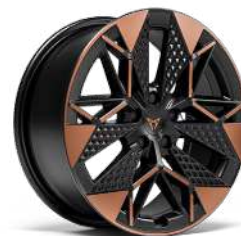
"VANDAL" R19 • Machined/Copper/Black (Raval Plus / Endurance / VZ)