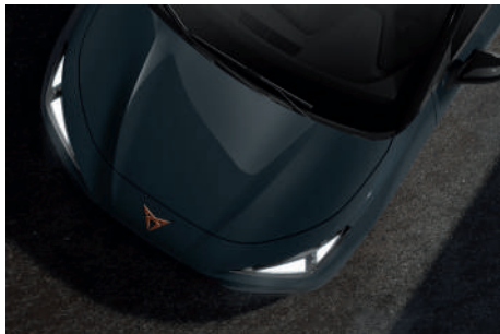
Fiord Blue (9K9K)