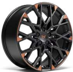
"ICON2" R19 (R9B) • Machined/Black/Copper (VZ)