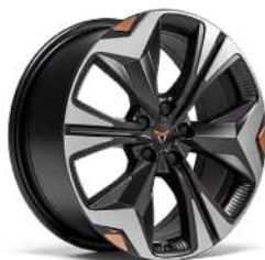
"MAVERICK" R19 • Machined/Black/Copper (Raval Plus / Endurance)