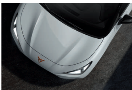
Glacial White (2Y2Y)