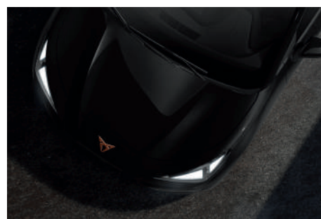
Midnight Black (OEOE)