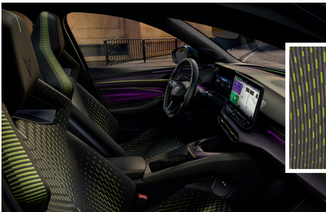
"SULFUR" 3D-kootud istmeviimistlus (VZ)