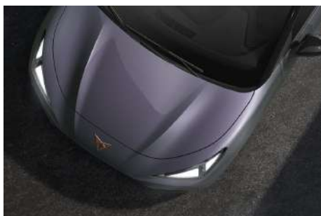
Plasma Iridescent (8D8D)