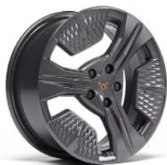
"RAVAL" R17 • Grey (Raval)