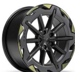
"REBEL Sulfur" R19 (PX1/U40) • Machined/Grey/Black/Sulfur (VZ)