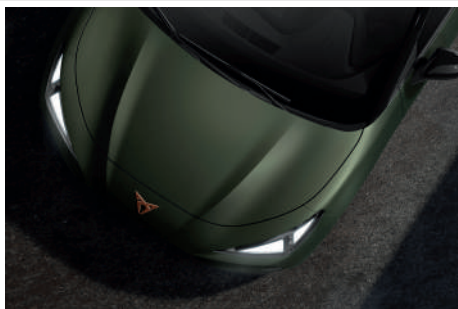
Manganese Matt (F2F2)