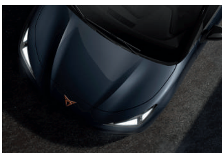
Magnetic Tech Grey (S7S7)