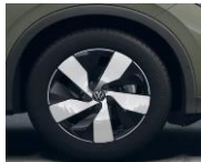
18" Bologna, Elegance