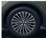
18" Napoli, Elegance vakio