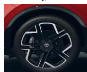
20" York, R-Line