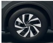
17" Venetia, Comfort vakio