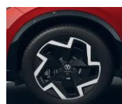
19" Coventry, R-Line vakio