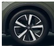
19" Catania, Elegance