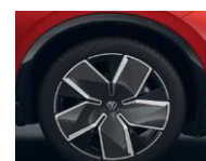
20" Leeds, R-Line