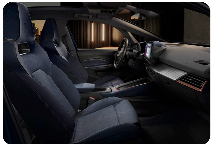
Fotod on illustratiivsed. Auto välimus sõltub valitud varustustasemest.