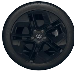
York 18" Black (Black Style-paketti)