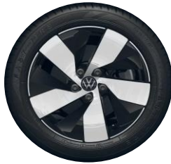
Bologna 17" Black PJC