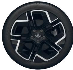
York 18" Black PJM