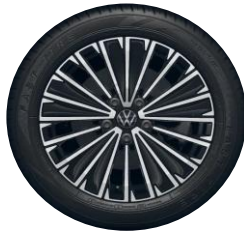
Napoli 17" (Elegance vakio)