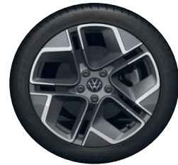
York 18" Dark Graphite PJD