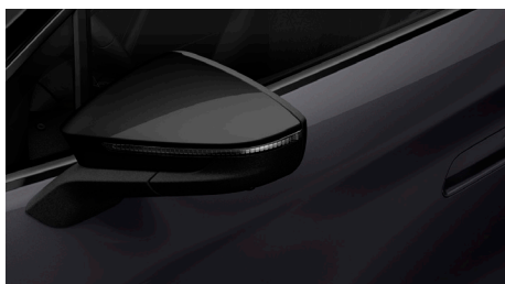
Basalt Grey (5K5K) (juodos spalvos išorės apdailos elementai)