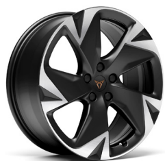
Lengvojo lydinio ratlankiai "Vulcano" R19 (bazinė įranga ENDURANCE Plus versijoje)