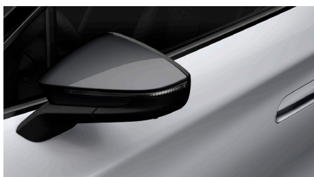
White Silver (K8K8) (pilkos spalvos išorės apdailos elementai)