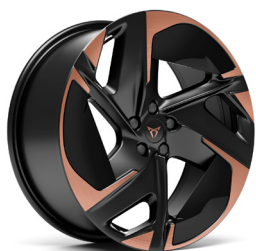
Lengvojo lydinio ratlankiai "Katla" R21 (WEL) (papildoma įranga VZ Plus versijoje)

Pateiktos nuotraukos yra iliustracinio pobūdžio.