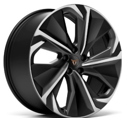
Lengvojo lydinio ratlankiai "Heckla" R20 (bazinė įranga VZ Plus versijoje)