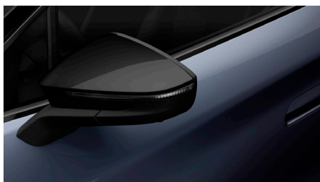
Tavascan Blue, metalizuota (D9D9) (juodos spalvos išorės apdailos elementai)

Pateiktos nuotraukos yra iliustracinio pobūdžio.