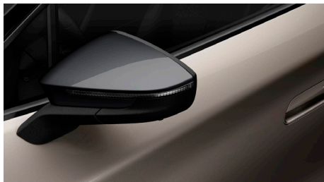
Atacama Desert, metalizuota (1B1B) (pilkos spalvos išorės apdailos elementai)