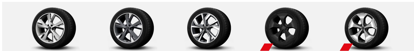
55J (S line Plus vakio)