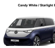
Candy White / Starlight Blue