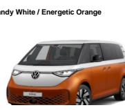
Candy White / Energetic Orange