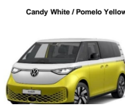
Candy White / Pomelo Yellow