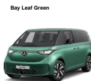
Bay Leaf Green