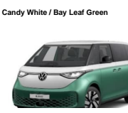
Candy White / Bay Leaf Green