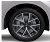
Braga 20" - R vakio