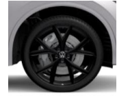
Estoril 22" Black