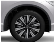
Tirano 19" Elegance vakio