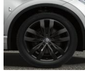
Leeds Black 21"