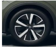
19" Catania, Elegance