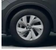
17" Bari, Comfort vakio