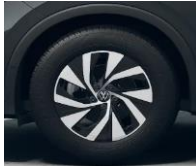
17" Venetsia, Comfort