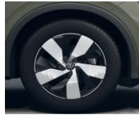
18" Bologna, Elegance