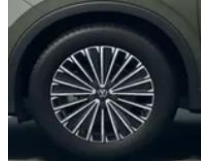
18" Napoli, Elegance vakio