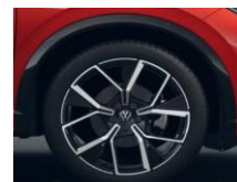
20" Leeds, R-Line