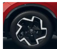
19" Coventry, R-Line vakio