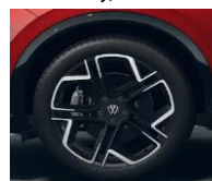
20" York, R-Line