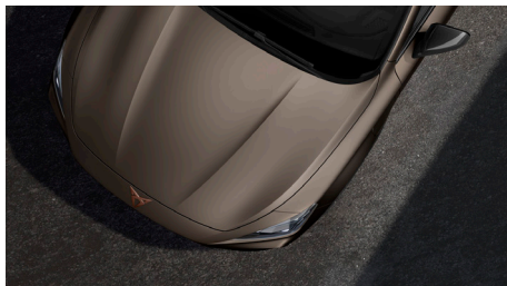
Century Bronze (L3L3)