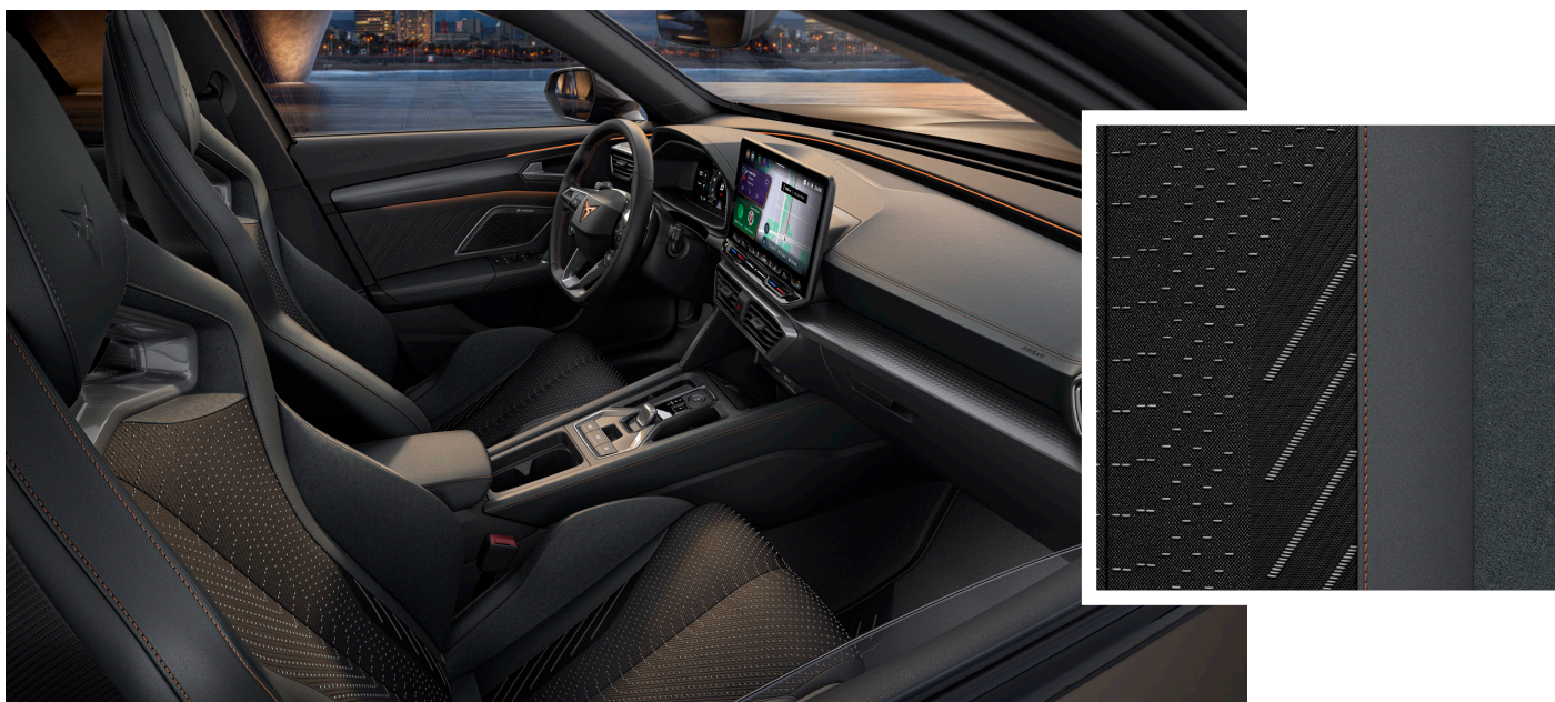
"Extreme Ambient" tekstilės/ mikropluošto/ odos imitacijos sėdynių apmušalai (bazinė įranga VZ Extreme versijoje)

Pateiktos nuotraukos yra iliustracinio pobūdžio.