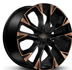
Lengvojo lydinio ratlankiai "Arctic Copper" R19 (Z9G)

Pateiktos nuotraukos yra iliustracinio pobūdžio.