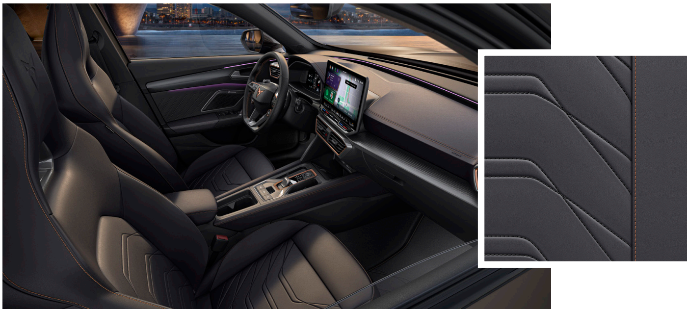
"Progressive Ambient" odos / odos imitacijos sėdynių apmušalai (PR2)