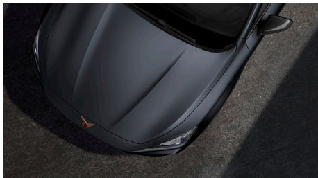
Magnetic Tech Grey (9R9R)