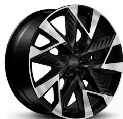
Lengvojo lydinio ratlankiai "Sandstorm" R19 (bazinė įranga VZ versijoje)