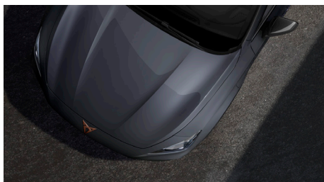
Graphene Grey (R6R6)