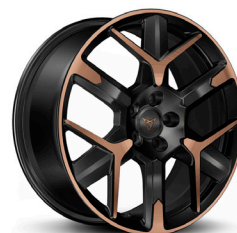
Lengvojo lydinio ratlankiai "Hailstorm Copper" R19 (bazinė įranga VZ Extreme versijoje)