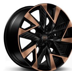
Lengvojo lydinio ratlankiai "Sandstorm Copper" R19 (Z9E)