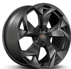
Lengvojo lydinio ratlankiai "Tempest" R18 (bazinė įranga CUPRA versijoje)