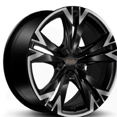
Lengvojo lydinio ratlankiai "Sonora" R18 (R8A) (papildoma įranga CUPRA versijoje)