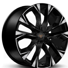
Lengvojo lydinio ratlankiai "Arctic" R19 (Z9C)