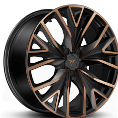
Valuveljed "Mistral Copper" R19 (R9G)