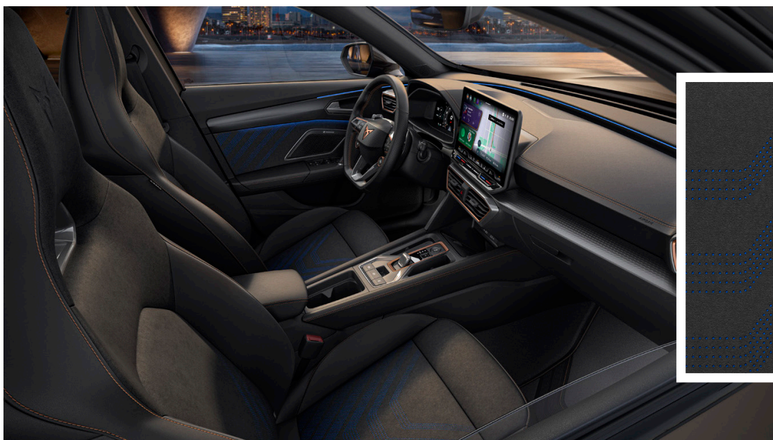
Mikrokiud/ kunstnahk istmekatted "Dinamica Ambient" (PS2) (VZ põhivarustus, CUPRA valikvarustus)