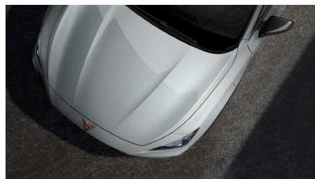
Glacial White (2Y2Y)