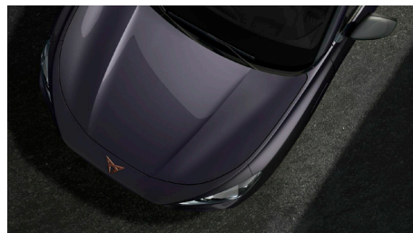
Dark Void (Q5Q5)