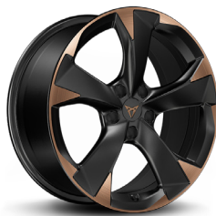
Valuveljed "Garbi Copper" R18 (R8E) (CUPRA valikvarustus)