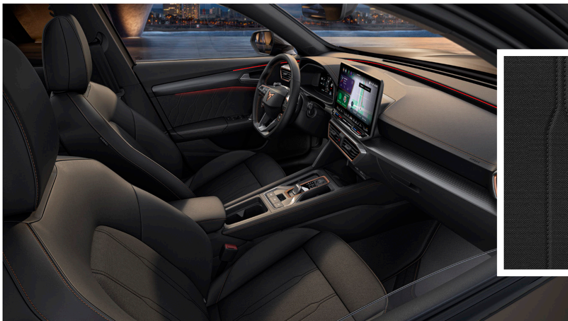
Tekstiilist/kunstnahast istmekatted "Sharp Ambient" (CUPRA põhivarustus)