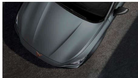
Enceladus Grey (Q7Q7)