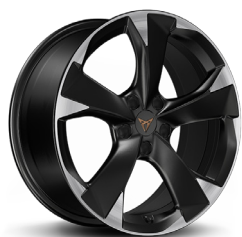
Valuveljed "Garbi" R18 (R8B) (CUPRA valikvarustus)