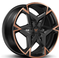
Valuveljed "Polar Copper" R19 (R9E, PD2)