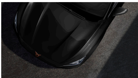
Midnight Black (OEOE)