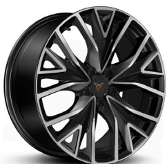
Valuveljed "Mistral" R19 (R9C)