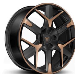
Valuveljed "Hailstorm Copper" R19 (R9N)