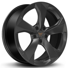
Valuveljed "Garbi Dark Shadow" R18 (CUPRA põhivarustus)