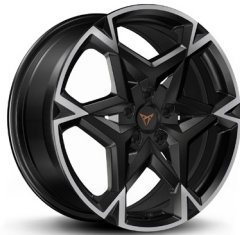
Valuveljed "Polar" R19 (VZ põhivarustus)