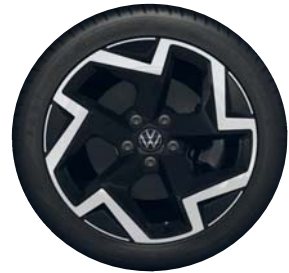
Coventry 18" (R-Line vakio)