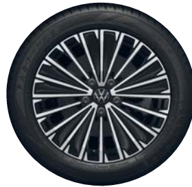
Napoli 17" (Elegance vakio)