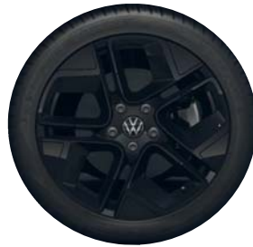
York 18" Black (Black Style)