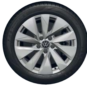
Genua 17" (Comfort eHybrid vakio)