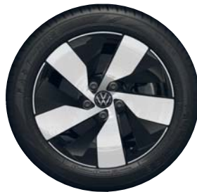
Bologna 17" Black PJC