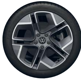
York 18" Dark Graphite PJJ