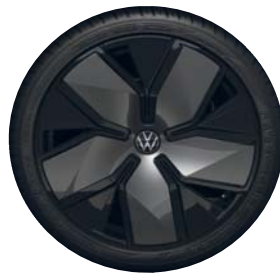
Leeds 19" Black (Black Style + PJN) (R-Line Signature + PJN)