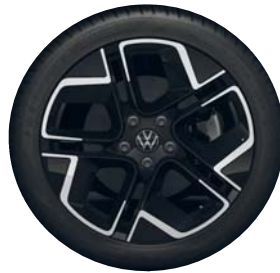
York 18" PJM