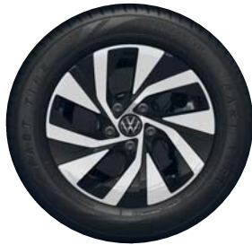
Venetsia 16" (Comfort vakio)