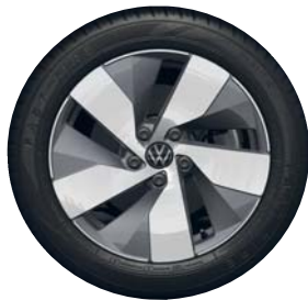
Bologna 17" PJB