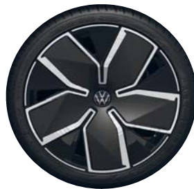
Leeds 19" (R-Line Signature)